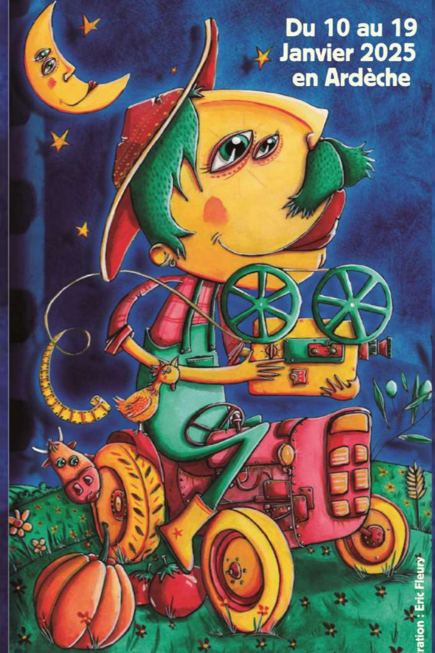
Illustration : Eric Fleury