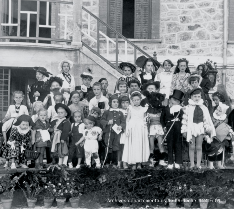
Archives départementales de l'Ardèche, 124 Fi 51.