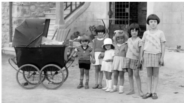
Archives départementales de l'Ardèche, 105 F. 1766.

Toutes les activités proposées sont gratuites et ont lieu aux Archives départementales. L'inscription est conseillée (nombre de places limité) et se fait auprès des Archives départementales.