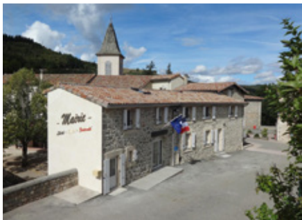
Mairie de Belsentes, site internet www.belsentes.fr .

Belsentes est née le 1 er janvier 2019 de l'union de deux communes : Les Nonières et Saint-Julien-Labrousse. La gestion est la même que pour les anciennes communes, mais tout est mis en commun sur un territoire plus grand et plus peuplé. Les moyens matériels et humains comme les archives sont mutualisés et les pratiques de fonctionnement sont harmonisées conformément à la charte validée par les deux conseils municipaux des anciennes communes. Raymond Fayard, maire des Nonières de 1983 à 1986 et de 1999 à 2018, est désormais maire de Belsentes depuis le 1 er janvier 2019.