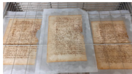
Étape du processus de restauration : séchage de pages.

Depuis 2017, les Archives départementales de l'Ardèche se sont lancées dans un programme pluriannuel de restauration des compoix. Ces documents, parmi les plus anciens et les plus précieux de nos fonds, proviennent des archives communales déposées et sont souvent en très mauvais état. Ancêtres du cadastre, ils sont indispensables pour connaître la situation économique et fiscale des territoires et des communautés d'Ancien Régime. Au fur et à mesure des classements et suivant l'urgence sanitaire, nous confions de 3 à 5 pièces par an à une restauratrice spécialisée (Aurélié Tanguy, basée dans le Gard). L'objectif est de permettre à nouveau leur manipulation en