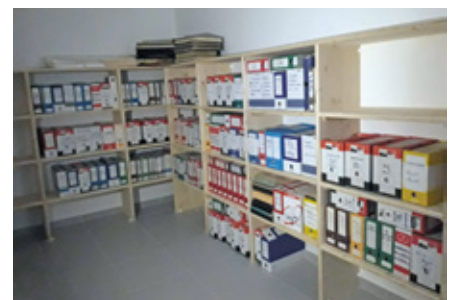
Archives communales de Saint-Julien-Labrousse (août 2019).

juin 2019 pour lui proposer des outils et une méthode de travail et l'assurer de son suivi. Assidue et motivée, Claudie isole les archives à éliminer, reconditionne puis supervise le transfert et l'installation dans le nouveau local. Une visite en août 2019 a permis aux Archives de constater avec enthousiasme que la mission avait été rondement menée, en à peine deux mois. Elle a aussi été l'occasion de collecter les archives modernes des Nonières, lesquelles sont depuis classées et consultables aux Archives départementales. ■