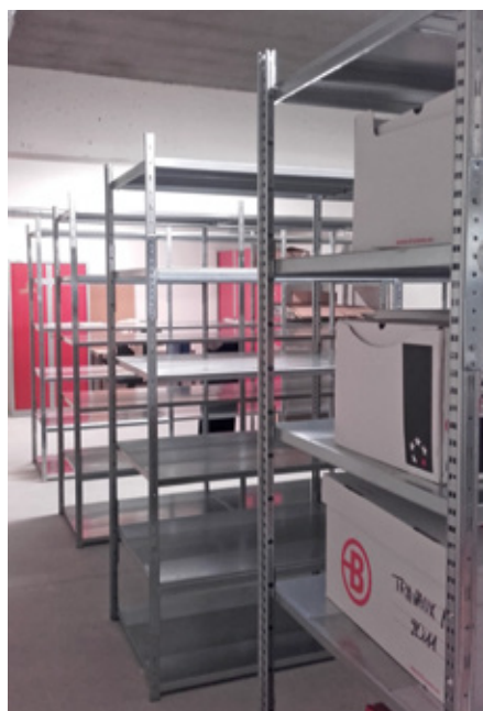
Local d'archivage de la DRAGA (janvier 2020).