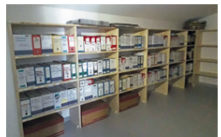
Archives communales des Nonières (août 2019).