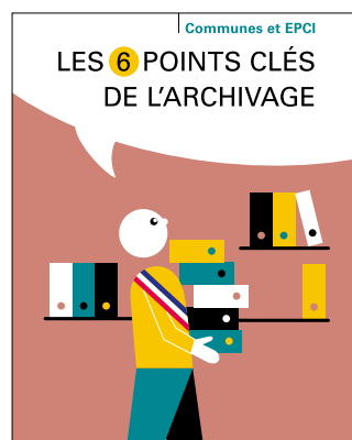
Brochure éditée par les AD07.

formaliser le transfert de responsabilité des archives entre anciens et nouveaux élus. Mais le récolement est aussi un état des lieux qui permet aux collectivités de prendre connaissance de leur patrimoine écrit : lacunes constatées et documents à rechercher, équipement et sécurité des locaux, état matériel des documents, éliminations à prévoir... Il s'agit donc d'un outil indispensable contribuant à l'efficacité du travail administratif, à la continuité de l'action publique et essentiel à la connaissance de l'histoire locale. Pour accompagner les collectivités dans la rédaction de leur récolement, les Archives départementales