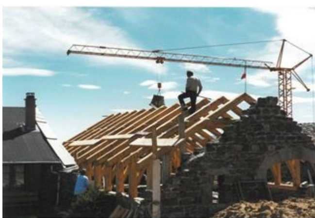
Restauration de la bâtisse (2001)

Aujourd'hui bien installée dans le paysage du massif et au delà, l'Ecole du vent participe à la dynamique de ce territoire rural avec des milliers de visiteurs qui arpentent, dorment, se restaurent et participent à faire vivre le pays.