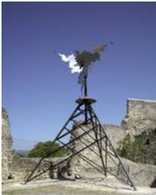
Petrolio (Locus desertus) Acier, fonte, inox 850 x 650 x 570 Bernhard Rüdiger, 2006 Collection de l'IAC

En accueillant en 2017 et 2018 la sculpture sonore Petrolio ( Locus Desertus ) en partenariat avec l'Institut d'art contemporain de Villeurbanne-Rhône-Alpes, l'Ecole du vent et la Commune de Saint-Clément proposent une approche artistique nouvelle autour du vent.