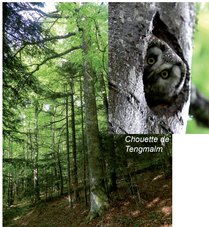
Chouette de Tengmalm

En mai 2015, un repérage précis des habitats potentiels de la Chouette de Tengmalm a été réalisé par l'ONF en parcourant l'intégralité du site : plusieurs cavités pouvant accueillir la chouette ont été identifiées. D'après les données historiques, le site des Sucs de Breysse serait un des premiers sites occupé par cette petite chouette en Haute-Loire .