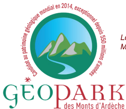
Logo du Géopark des Monts d'Ardèche