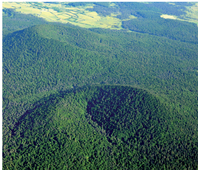
Les sucs de Breysse : deux jeunes anciens volcans...