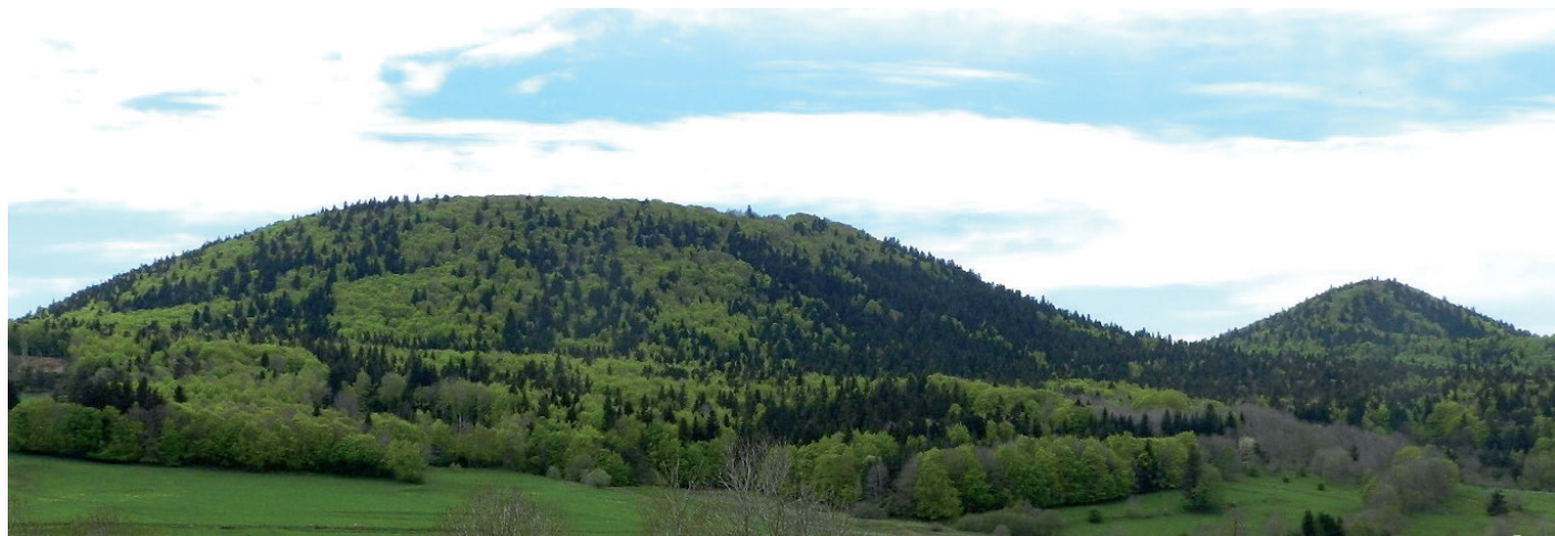
Les Sucs de Breysse depuis le village de Présailles