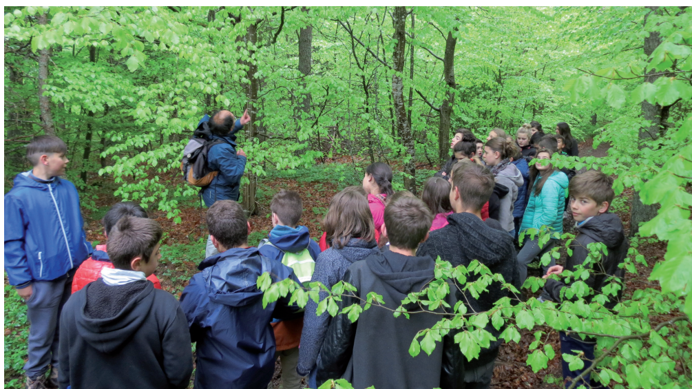
Classe de 5 ème en sortie dans la forêt des Sucs de Breysse