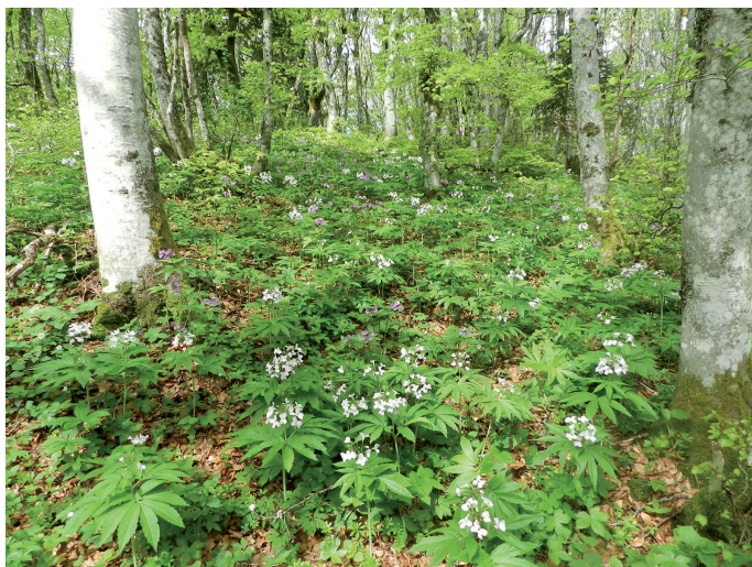
Tapis de Cardamine à sept feuilles sous les hêtres

Au total, et ce n'est certainement pas tout à fait exhaustif, plus de 80 stations d'espèces végétales patrimoniales ont été identifiées.