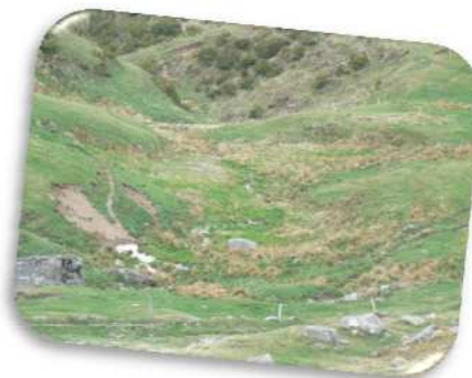
Zone humide de la tête de la Saliouse