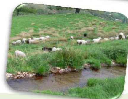
Ovins et béalière, Saint Julien du Gua