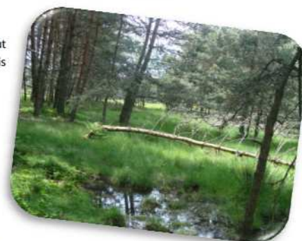
Sagne du Haut Vivarais